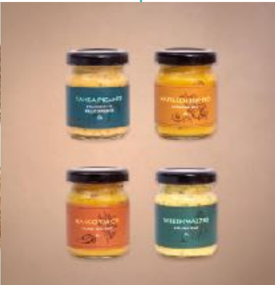
BIO ITALIENISCHE GEWÜRZE LUIGI